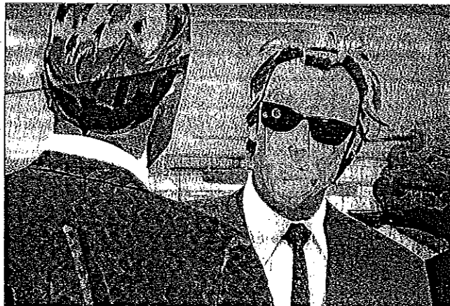
ARTS SANTA MÓNICA